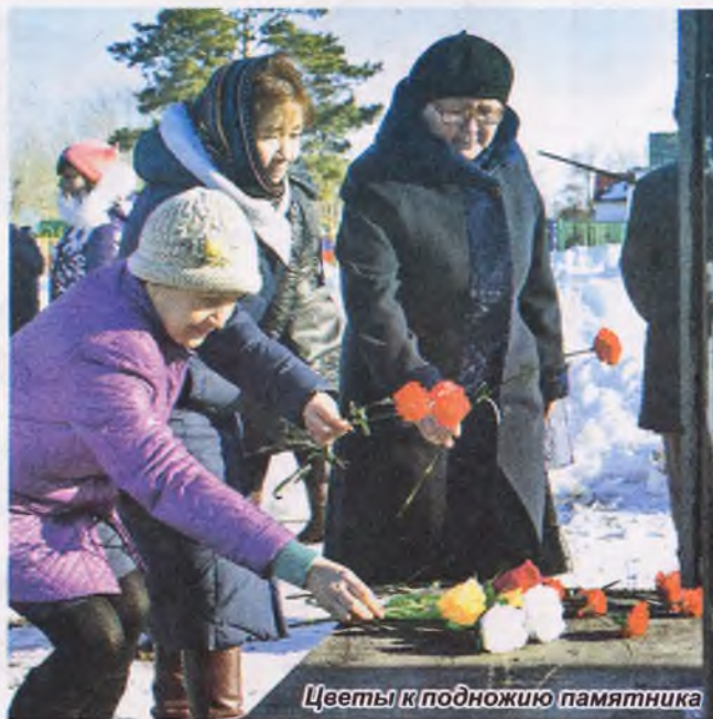
Цветы к подножию памятника

Фигуру выполнили из цемента, залитого в гипсовую форму, а затем отполировали. В руке космонавта — тюльпан, первый весенний цветок в казахстанской степи. Кстати, в разные годы статуя космонавта имела разный цвет — бронзовый, серебристый, теперь шаровый. Хорошо помню день открытия памятника. От совхозной конторы по улице Энтузиастов, а затем по улице Гагарина шла праздничная колонна передовиков производства, школьников. Люди несли флаги, транспаранты, цветы и еловые гирлянды. Был торжественный митинг.