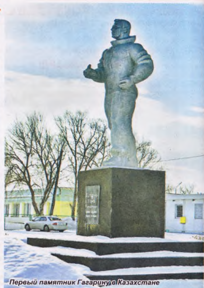
Первый памятник Гагарину в Казахстане