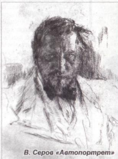
В. Серов «Автопортрет»