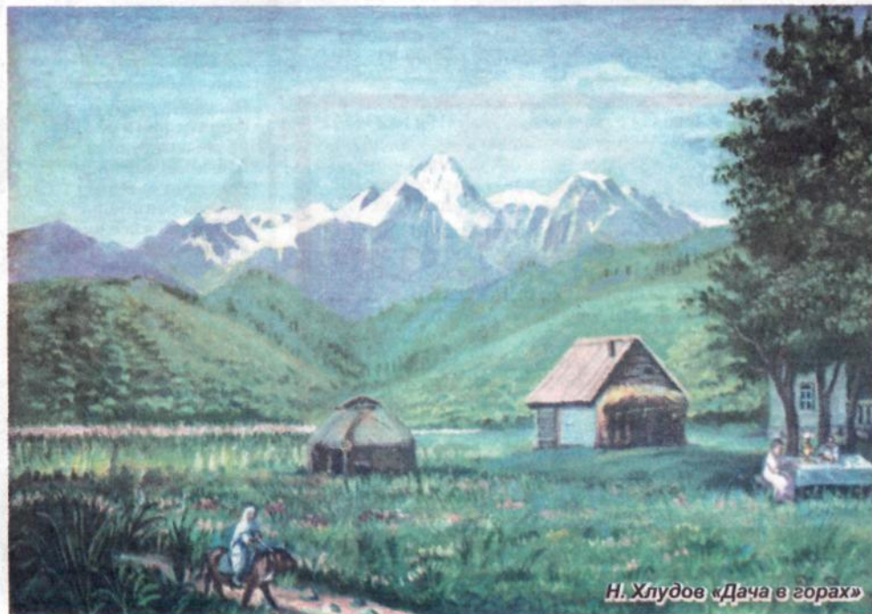
Н. Хлудов «Дача в горах»

Марина КИСЕНКО.