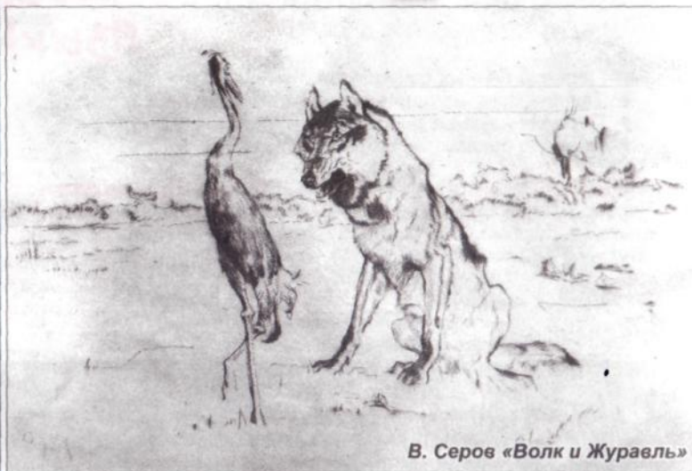
В. Серов «Волк и Журавль»

Именно на этой выставке в рамках проекта «Век», презентованной на прошлой неделе в Павлодарском областном художественном музее, можно познакомиться с творчеством всемирно известного мастера Валентина Серова, чьи произведения ещё недавно заставляли ценителей живописного искусства выламывать двери в крупные российские галереи. А ещё здесь можно увидеть картину русского художника Николая Каразина, возраст которой 155 лет.