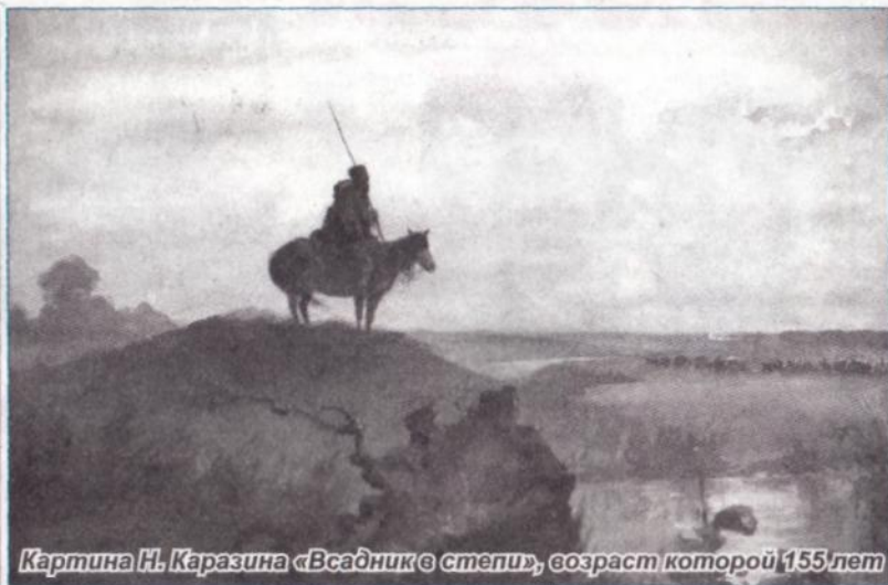
Картина Н. Каразина «Всадник в степи», возраст которой 155 лет