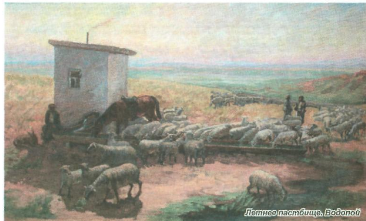
Летнее пастбище. Водопой