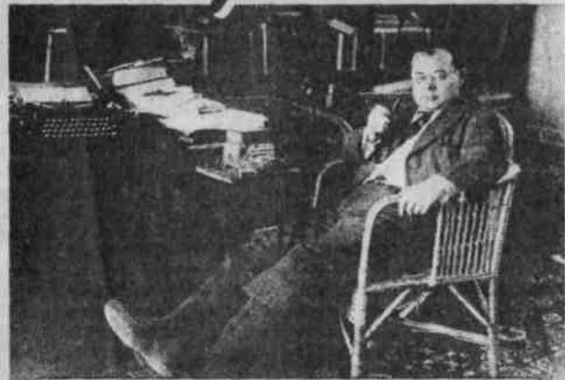
Писатель в своем рабочем кабинете на даче, сгоревшей в 1942 г. Переделкино, 1939 г.

В плену своих мечтаний и фантазий, совсем молодой Вс. Иванов покидает Казахстан, Павлодар и уходит в большую литературу.