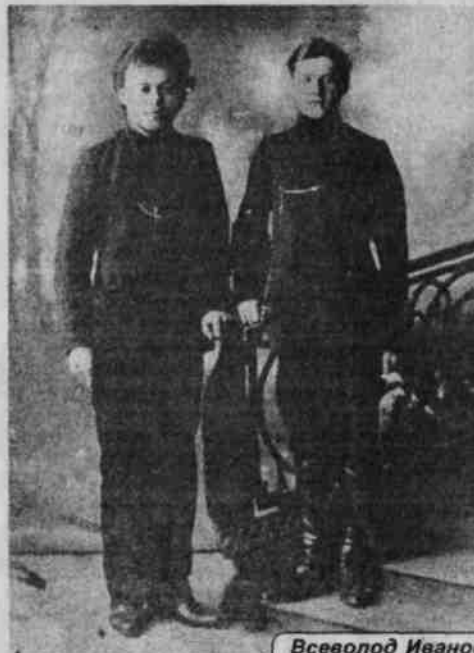
Всеволод Иванов (слева) в Павлодаре во время учебы в сельскохозяйственной школе.

"Я - писатель-самоучка - из тех, которых теперь много. За каждым из современных писателей - громадные залы университетов, лабораторий, многоученые профессора и предания. Мы учились в гуще жизни - бестолковой, несистематизированной и, в сущности, малознаю-